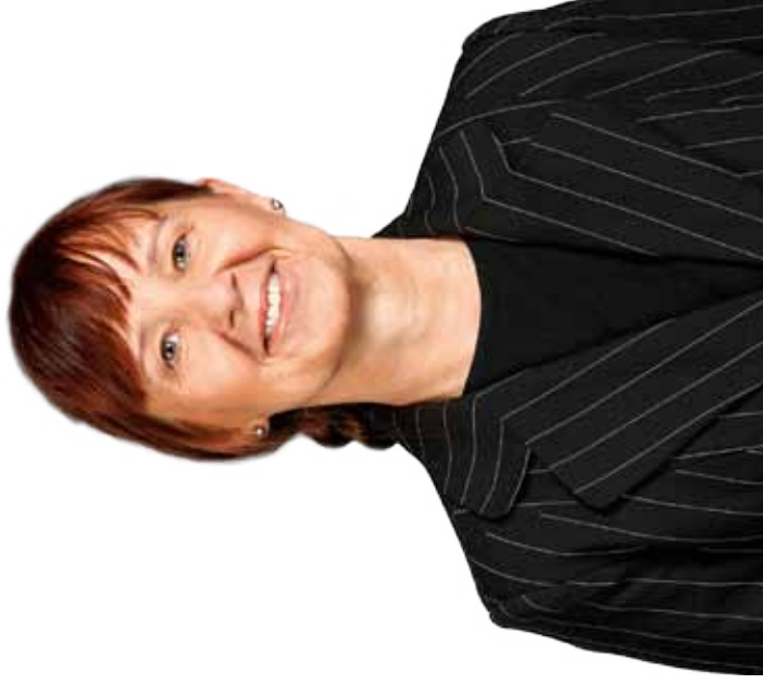
von Sabine Stüber

Übrigens, diese Form des Recycling, die da gerade erfunden wird, ist nicht